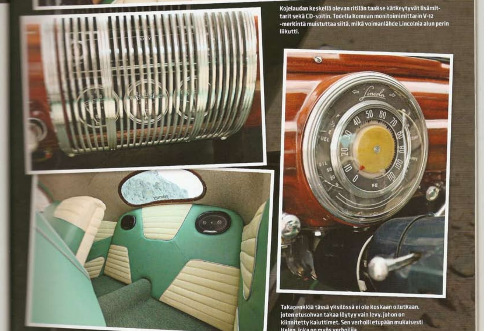
AMERIKAN RAUTA 4/2013