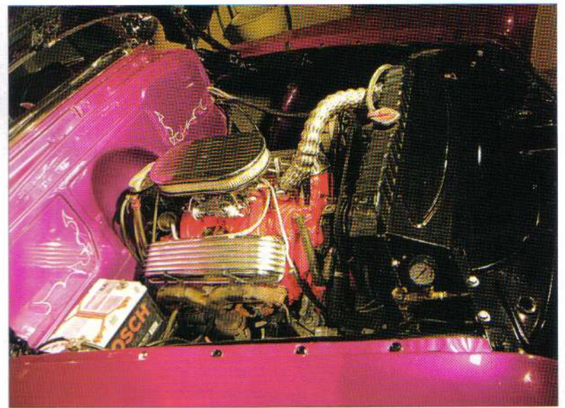
Konetila sai uuden maalipinnan ohella lisää kromia kuluneen talven aikana.