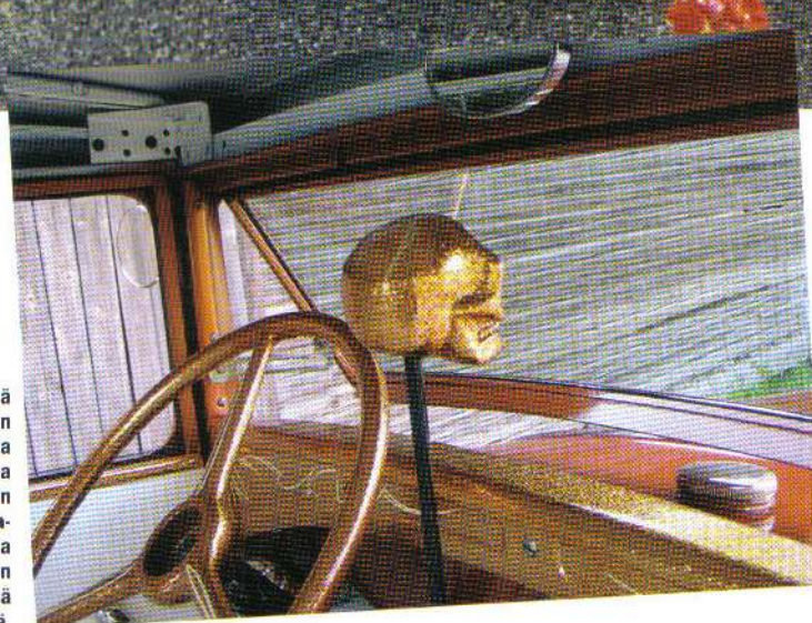
Kylmä kaveri shifterin huipulla arvostaa varmasti Fordin raitisilmamekanismia Suomen helteisessä kesässä.