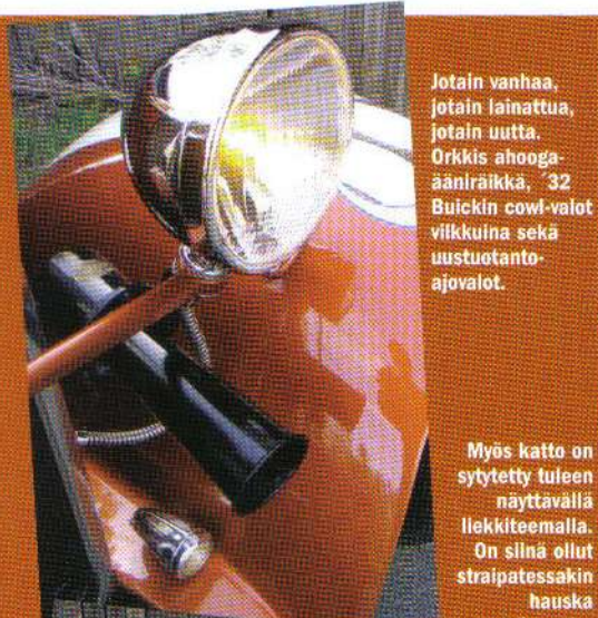
Jotain vanhaa, jotain lainattua, jotain uutta. Orkkis ahooga-ääniräikkä, '32 Buickin cowi-valot viikkuina sekä uustuotanto-ajovalot.