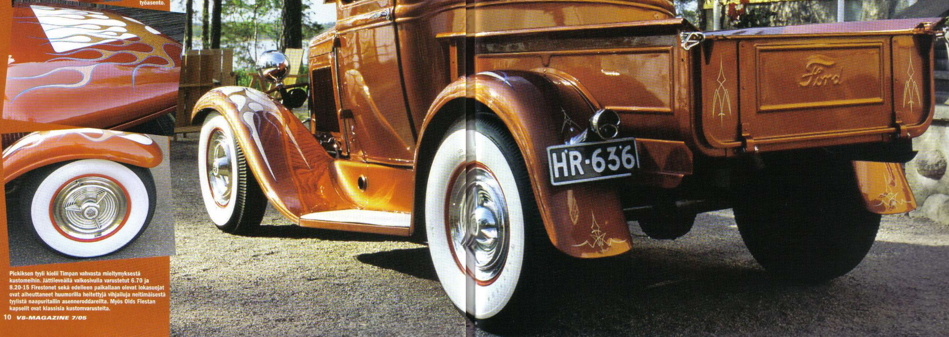
Pickiksen tyyli kieli Timpan vahvasta mieltymyksestä kustomelhin. Jättileveällä valkosivulla varustetut 6.70 ja 8.20-15 Firestone't sekä edelleen palkalleen olevat lokasuojat ovat aiheuttaneet huumorilla heitettuja vihjailuja neitimäisestä tyylistä naapuritallin asenneroddareilta. Myös Olds Flistan kapsellit ovat klassisia kustomvarusteita.