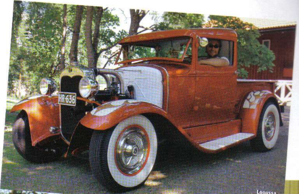
Lopussa kiltos selsoo...

Näyttelyn jälkeen viimeistely jatkui. Tietysti myös lättistekniikan mukanaan tuomat vesipumppu- ja kaasariongelmat piti hoitaa pois päiväjärjestyksestä. Kuitenkin vajaan vuoden päästä keon hankkimisesta Timppa oli vienyt läpi taas mittavan projektin, joka käsitti myös auton leimauttamisen takaisin kilpiin. Mitähän konnuuksia kierrätystallissa nyt kehitellään, lisää A-ryhmää? ☺