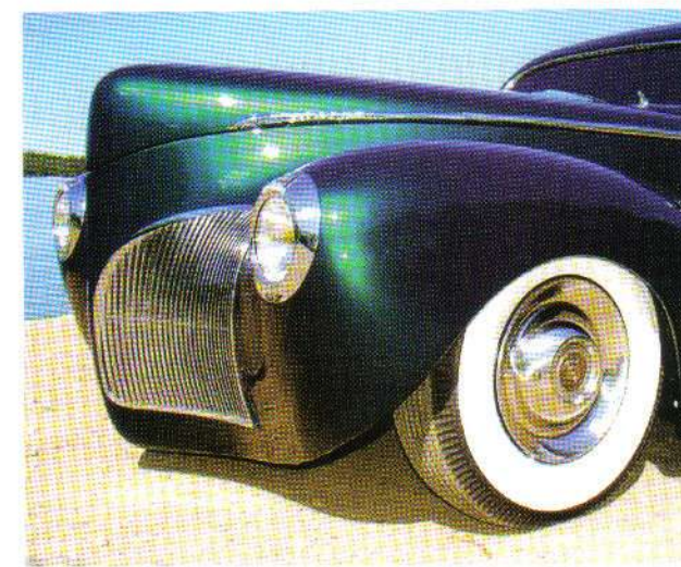
Linjerna på en sån här Lincoln är helt fenomenala redan original, och nu har dom blivit ännu bättre!

Den gamla trötta originalmotorn fick aldrig mer återse sitt gamla chassi, istället monterades en helt ny kartongmotor.