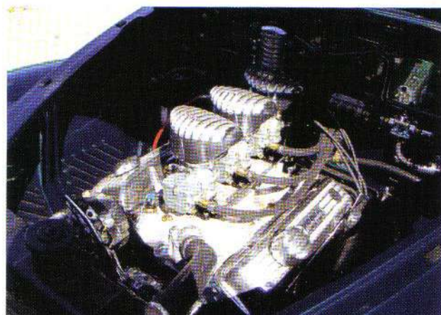
En ny cheva smallblock ser både bra ut, samt har helt ok prestanda!