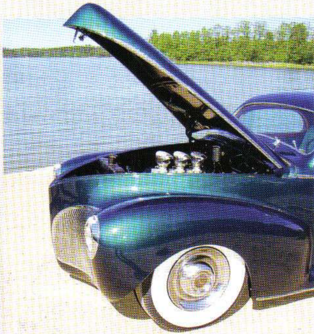
Green is mean and chrome is home.