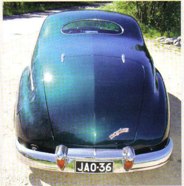
Recyclers har funnits i över 15 år och producerar grymma kustoms med jämna mellanrum