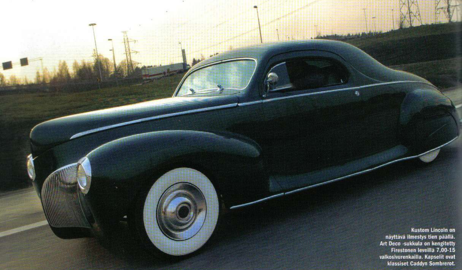
Kustom Lincoln on näyttävä ilmestys tien päällä. Art Deco -sukkula on kengitetty Firestonen levyillä 7,00-15 valkosivurenkailla. Kapselit ovat klassiset Caddyn Sombretot.